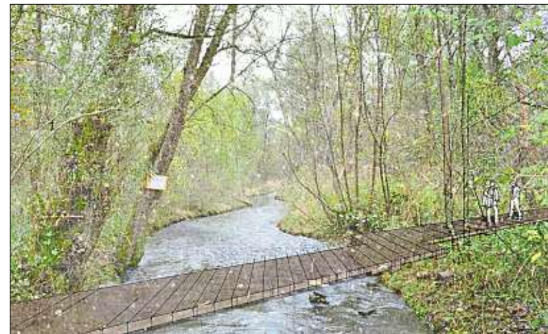
Wasserlandschaften , wie etwa Holzpfade durch den Wald und über Bachläufe, sollen entstehen und miteinander vernetzt werden.